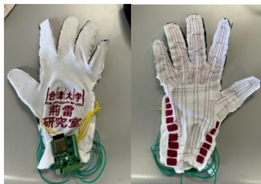
図 1 SignGlove 最終版：左は手の甲の写真、右は掌の写真

SignGloveの開発は、手話をリアルタイムで認識するためのデータグローブを作成することを目指しています。初期段階では、ブレッドボードとRaspberry Piを使用したV1から始まり、PCB基板を導入したV2、最終的には100個の圧力センサーを手袋に実装したV3まで改良が進められました。最新バージョンのV3では、手袋のデータ収集に必要な機能をすべて搭載した回路基板を研究開発することにより、SignGloveの小型化と携帯性を実現しました。防水、防塵、耐久性などについては、機能改善の必要がありますが、現段階の完成品は小型化や軽量化、および装着の快適性において優れています。さらに、手話単語認識訓練のための大量のデータ収集実験により、連続使用の信頼性が十分に検証されています。